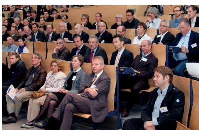
Rund 300 Gäste nahmen an der Eröffnung des Kongresses teil